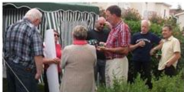
Arrivée à Boé, la veille pour certains, un peu avant pour d'autres plus chanceux, accueil et retrouvailles ...