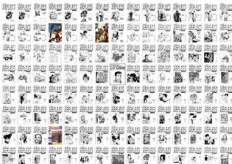
Poster des couvertures de notre magazine préféré

9 ème Assemblée du Sud-Ouest de la France - 23 juin 2012 - BOÉ