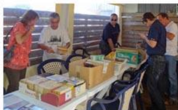
Le samedi enfin arrivé, après un bon déjeuner pris ensemble, c'est le début des choses sérieuses : la bourse d'échange et il y a de quoi satisfaire les recherches, avec des prix d'amis.