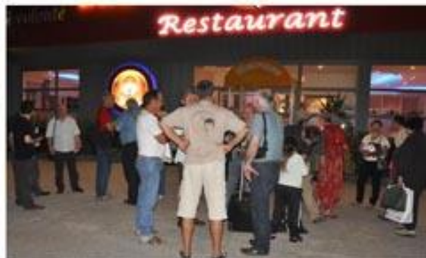
Hélas, le temps passe bien trop vite entre amis et il est déjà tard lorsque que nous promettons de nous retrouver pour la prochaine !