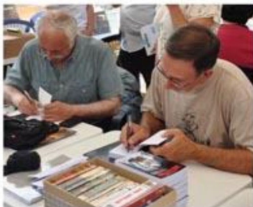
à l'AG du sud-ouest, il y a des auteurs ...