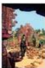
Quelques cartes postales