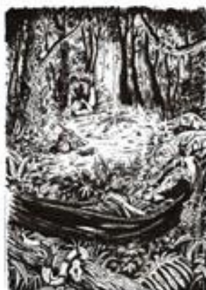
Dessins de Serge Paquot