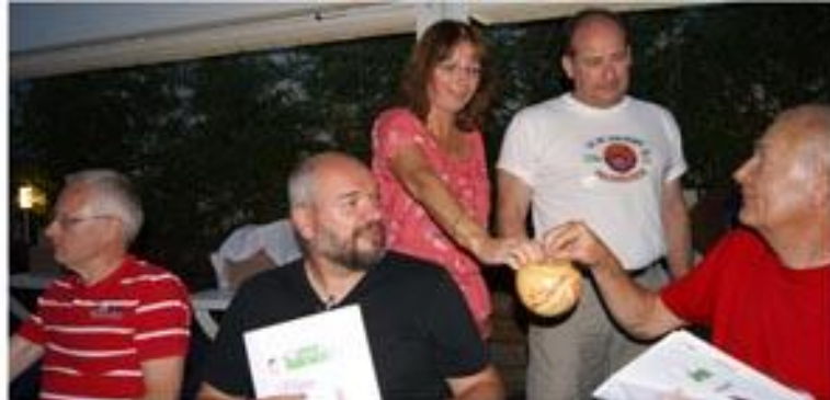
Après que chacun ait pu profiter des ressources quasi inépuisables du buffet, arrive l'heure de la participation à la tombola...