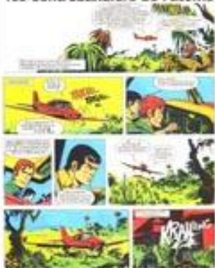
Planche BD en EO signée par Henri Vernes