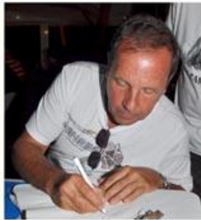
Mais il ne faut cependant pas oublier le petit mot pour les absents...