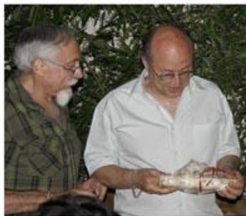
...beaucoup d'heureux car tout le monde gagne.