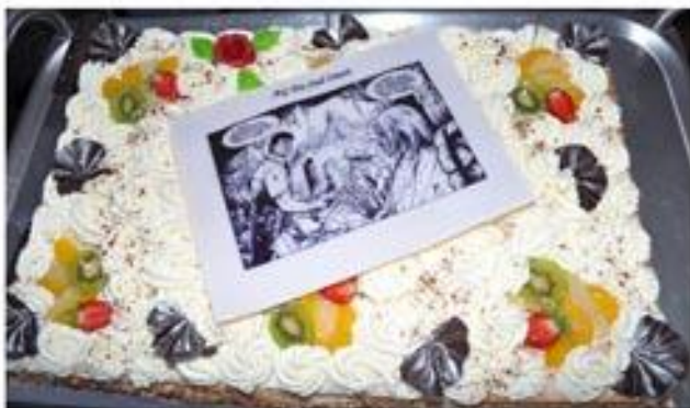
... qui ne pourront pas goûter le délicieux gâteau !