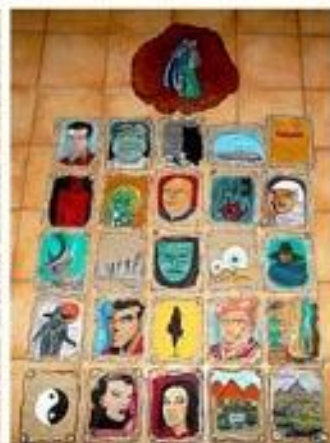
L'ensemble de œuvres de l'artiste peintre