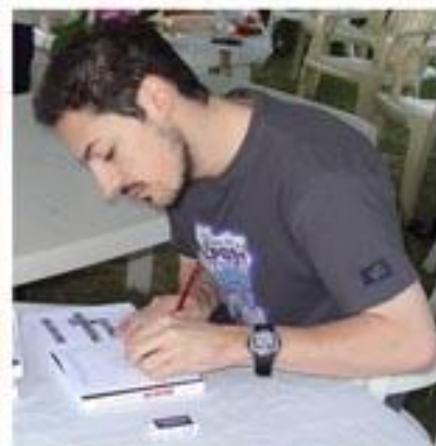
... mais également des dessinateurs en dédicace !