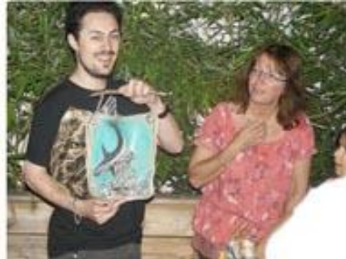
...où les peintures originales sur toile, réalisées par Isabelle Barthe, ont fait des heureux...